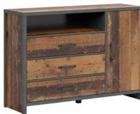
sosna oldstyle ciemna/ matera

Piękna kompozycja mebli młodzieżowych utrzymanych w stylistyce loftowej. Proste kształty, wyrazisty dekor drewna, pogrubione boki i blaty i oryginalne uchwyty to sprawdzony przepis na niebanalne wnętrza.