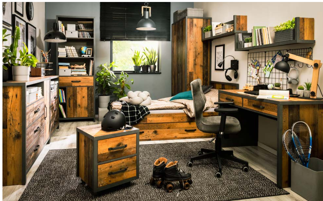
Krzesełko obrotowe UNI ; komoda KOM1D3S/130 ; regal REG1D1S ; szafa SZF2D2S ; szafka wisząca SFW/120 ; łóżko LOZ/90 ; szuflada do łóżka SZU/162 ; biurko BIU2S ; kontenerek KTN2S