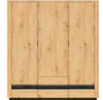
szafa SZF2D2S szer./gt./wys. 100,5/56/199 cm