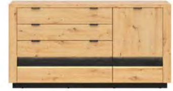
dąb artisan/black glow/dąb czarny

Piękna, nieszablonowa, współczesna. Taka jest najnowsza kolekcja Ostia. Z myślą o wygodzie użytkownika wewnątrz mebli oraz dekoracyjną deskę uzupełniliśmy o energooszczędne oświetlenie LED. Dzięki temu wygląda zachwycająco nie tylko za dnia, ale również nocą.