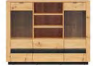
witryna KOM2W2S szer./gt./wys. 161/42/123,5 cm

łóżko z pojemnikiem i podnoszonym steżem