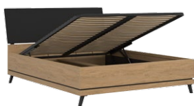
AT 15/120-140-160-180 S.P. łóże 120-140-160-180 ze stelażem metalowym oraz pojemnikiem

Materace oraz stelaże -str 76 Mattress and bedsteads -page 76