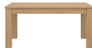
ST 08 - stół rozkładany →/↗/↖/↑ 160-200/90/76