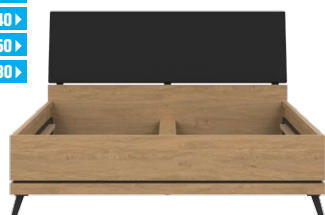
AT 15/120-140-160-180 łóże 120-140-160-180 bez stelaża i pojemnika →/↗/↖/↑ 128-148-168-188/220/106